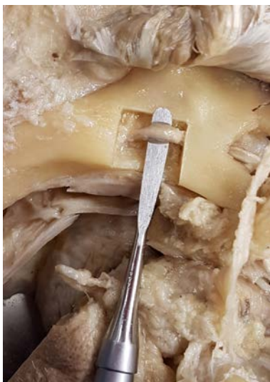
Abb. 8: Knochenspanbildung und Nervdarstellung im Unterkiefer mittels PiezoSurgery® der Fa. Mectron.

Die praktischen Übungen verteilten sich auf den Tischen wie folgt: Sinusverfahren wurden mit den Standard-techniken demonstriert und die simultanen Implantationen sowie der indirekte Sinuslift sollten von einem „Tischteam“ geübt werden. Im Anschluss konnten die gleichen Verfahren mit der Piezotechnik ausprobiert werden. Unter der fachlichen Assistenz der Mitarbeiterin der Firma Mectron, die die PiezoSurgery®-Geräte freundlicherweise zur Verfügung gestellt hatte, gelang dies in perfekter Weise. Ein weiterer Übungstisch stellte die Themen Bone Splitting, Condensing, Nervdarstellung und Präparation, im Oberkiefer-Verfahren zur Umgehung eines Sinuslifts bzw. des Nervus mandibularis sowie das All-on-four-or-More-Prinzip in den Vordergrund. Prof. Dr. Valentin, ein anerkannter Experte im Bereich der autologen Kno-